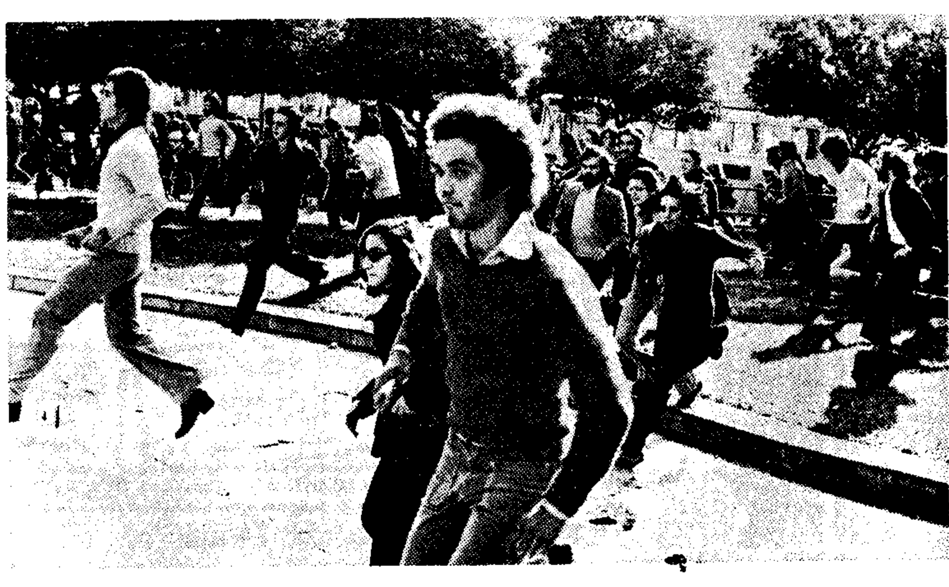
Μία χαρακτηριστική εικόνα από τις χθεσινές διαδηλώσεις των σπουδαστών και από τά επεισόδια με την Ατυμορία άποσείων προς τό δικαστήριο χώρους.